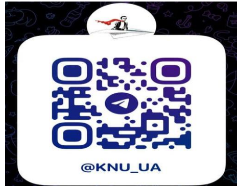
Більше новин КНУ в телеграм каналі