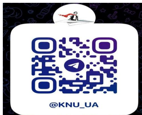
Більше новин КНУ в телеграм каналі